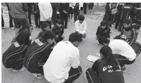
芸術鑑賞会と学友団活動