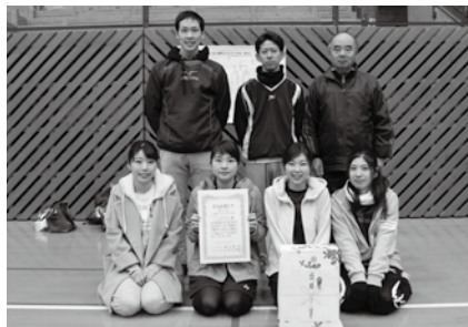
優勝「チーム愛夢里」