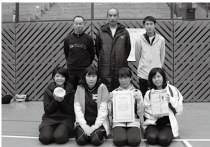
準優勝「スパンキー」