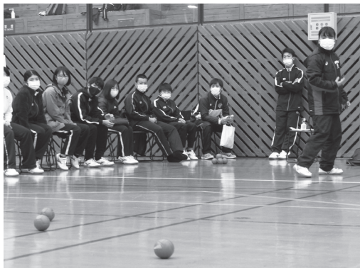
「ポッチャ」を楽しむ生徒たち

3年生にとっては今年度、最初で最 後のクラスマッチとなりましたが、全 校生徒で楽しむことができ、思い出に 残るものとなりました。