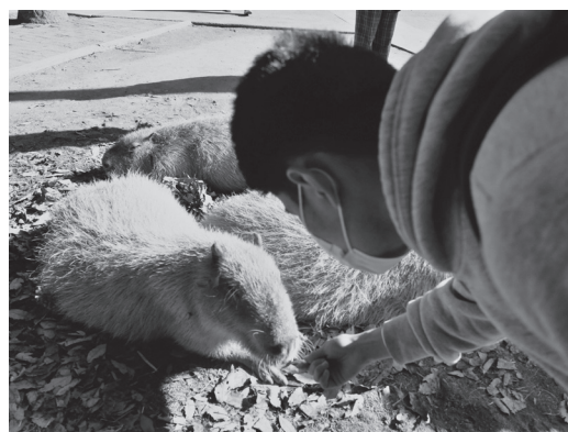
カピバラとふれあう生徒

生徒達は、たくさんの思い出と貴重 な体験を通して、様々なことを学んだ とともに、仲間との友情を深めること ができたようでした。