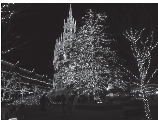
ハウステンボスのイルミネーション