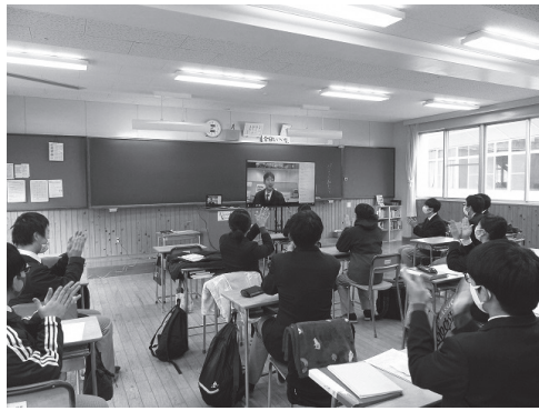
モニターを通じて生徒会へ拍手がおくられた

当日は朝早くから、生徒たちでシス テムのチェックやりハーサルを行い、 本番のホームルーム。教室ではモニ ターに映像が写し出されると歓声が上 がり、生徒会に拍手がおくられました。