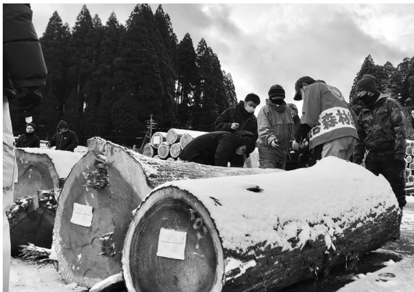
初市は大寒波が直撃。吹雪の中での入札でした。

出荷量は昨年より多く、2,526㎡(杉2,436㎡・桧90㎡)となりましたが、メインとなる材が無く、平均単価は10,803円と昨年と比べ若干の安値となりました。