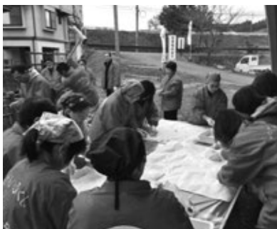
人権餅つきの様子（隣保館にて）

隣保館では、人権もちつきが行われ、早朝より、連合婦人会をはじめ、町内各事業所からのご協力により、紅白もち1200個（600組）を啓発グッズと一緒にJA会場