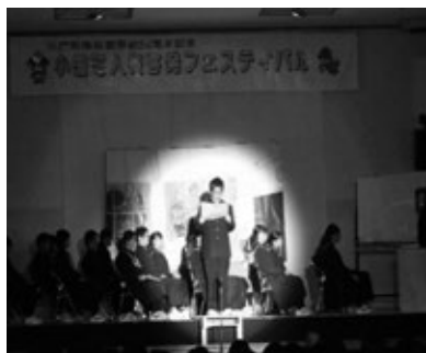
小国中学校8年生（劇）『思いを伝え合う～59人の仲間～』

また、中学8年生による人権劇では、クラスで独りぼっちになったときの行動について考える劇『思いを伝え合う』59人の仲間です』を発表し、一人でも悩まず、勇気を出して思いを伝えることの大切さを訴えました。