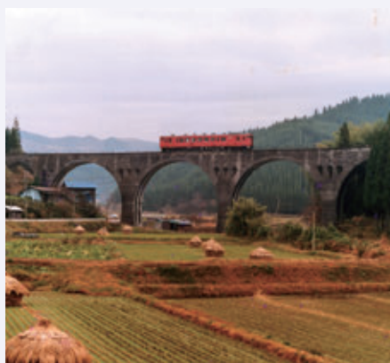
旧国鉄宮原線運行当時の写真(宮原-北里間)

肥後小国駅跡(ゆうステーション)から北里駅跡(北里森のキオスク横)をつなぐ廃線ルートは、現在遊歩道として利用されています。線路こそないものの、アーチ橋やトンネルが残され当時の雰囲気味わうことが出来ます。また、この区間は広葉樹の多い区間でもあり、野鳥のさえずりを聴きながら廃線跡歩きが楽しめることもあり、ツアー客など年間約1000人の方々に利用されています。