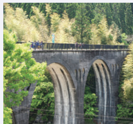
廃線跡歩きのようす