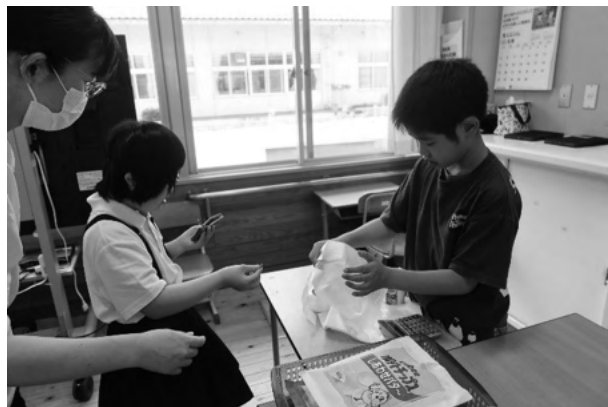
小学部 買い物ごっこ

特別支援学校では、どんなことを学 ぶのか、どのような環境で学ぶのかな ど本校の説明や施設見学を行うと共 に、小学部、中学部、高等部からも各 学部の特徴や学び方などについて説明 を行い、参加者からも多くの質問を受 け関心の高さが伺えました。