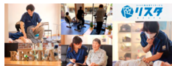
株式会社BEST REVE 「一人一人にベストを尽くす」 福祉サービスを通して、地域や入りを豊かにします