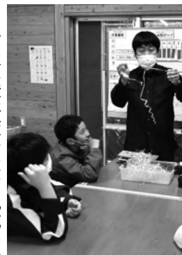
中学部 作業学習 緩衝材づくり

小国支援学校では、地域の幼稚園・ 保育園、小学校、中学校、高等学校に 対する巡回相談事業を行っています。