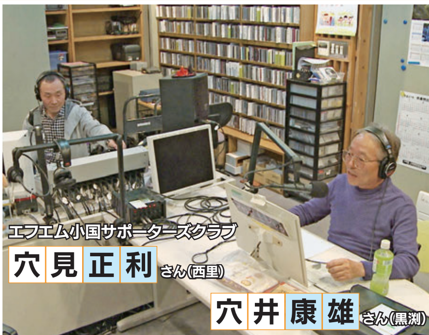
エフエム小国サポーターズクラブ