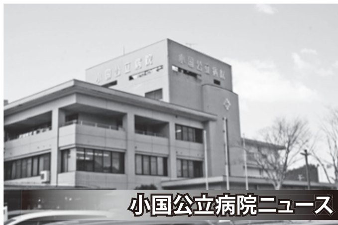
小国公立病院ニュース

平成12年4月の介護保険制度施行から15年が経過し、平成27年4月に介護保険法の改正が行われました。今回の、第6期介護報酬改定は、2025年(平成37年)に向けて、医療・介護・予防・住まい・生活支援が包括的に確保される「地域包括ケアシステム」の構築を実現していくため、次の基本的な視点により介護保険改正が行われました。