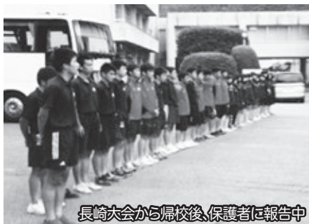
長崎大会から帰校後、保護者に報告中

7月10日(金)1年生を対象としたAED講習会がありました。小国消防署の方々を講師としてお招きし、胸骨圧迫、AEDの使い方、人工呼吸について講習をしていただきました。生徒たちは真剣に話を聴き、実際にこのような処置の必要な場面に遭遇した際、冷静な正しい判断で、的確な応急処置ができるように、実践を通して学んでいました。