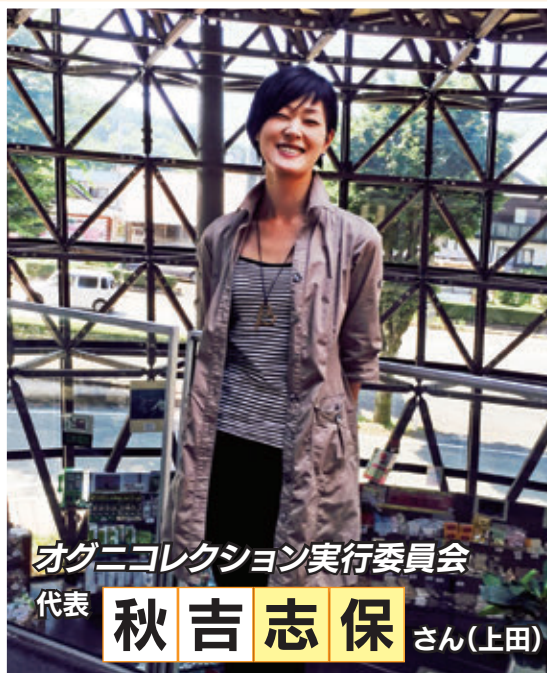
オグニコレクション実行委員会