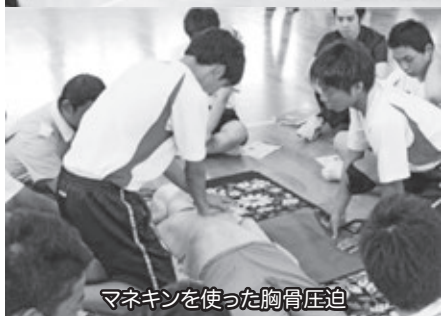
マネキンを使った胸骨圧迫