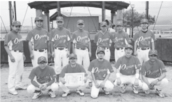
二連覇の男子ソフトボールチーム