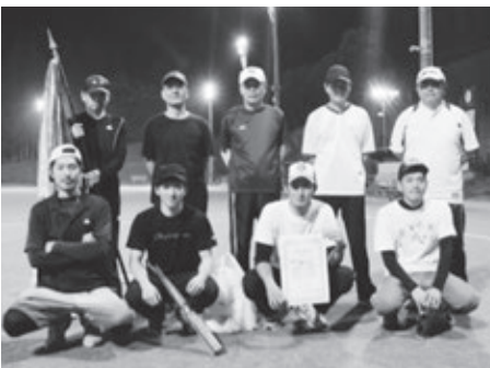
Bランク優勝 倉原バックス