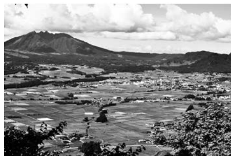
「明治日本の産業革命遺産」のHPはこちら！ http://www.kyuyama.jp/

熊本県でも今年夏頃、「明治日本の産業革命遺産」に関するイコモスの現地調査が実施されるため、「記載勧告」を目指して現在準備を進めています。