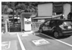
湯けむり茶屋駐車場