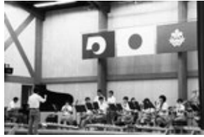
演奏発表 1年 音楽選択者