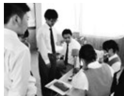
看護・医療系講義での活動