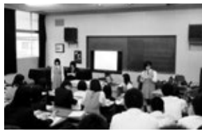
2年生 インターンシップ 事後報告会の様子

9月24日(水)と10月10日(金)、2年生のインターンシップの事後報告会がありました。夏休みにそれぞれ事業所で体験したことを、数人ずつのグループに分かれ、パワーポイントを用いて発表しました。5月から準備を始めたインターンシップでしたが、まとめと反省を経て、一回り成長して終えることができました。ご協力いただいた事業所様には大変感謝いたします。ありがとうございました。