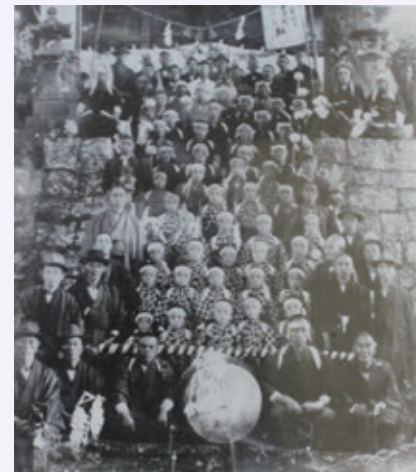
昭和14年10月 奉楽の記念写真

来る11月20日には、下城若宮神社大祭において奉納されます。皆さん、この機会にお出かけになってはいかがでしょうか。