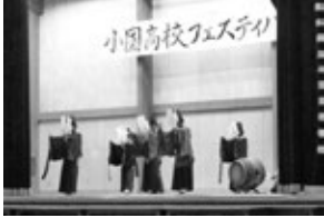
吉原神楽を舞う 1、2年生

2日目は、郷土芸能披露で幕を開けました。2年生1人、1年生4人が、地元の方々に教えていただいた南小国町の吉原神楽を厳肅な雰囲気の中で舞い、観衆を魅了しました。