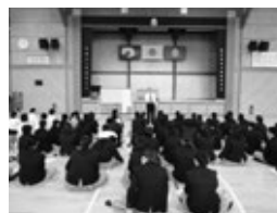
進学希望者コースの講演

10月9日(木)1、2年生を対象とした進路ガイダンスが行われました。進学希望者コース、就職希望者コース、公務員希望者コースに分かれて講演を聴いた後、それぞれの進路希望に応じた講義を受けました。講義は理学・工学系や看護・医療系、美容系等12講義あり、生徒は興味深そうに話を聞いたり、活動に参加したりしていました。看護・医療系では実際の測定器を用いて、血圧を測ったり、聴診器で心音を聞いてもらいました。興味のある分野について知ることが出来、自身の進路を改めて考えるよい機会となりました。