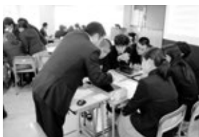
ライフプランニング セミナーの様子

10月10日(金)公益財団法人熊本県雇用環境整備協会によるライフプランニングセミナーがありました。受講した1年生は6名程度のグループに分かれ、さまざまな職業に就いた家族の疑似体験をすることで、進路選択の重要性を理解し、将来の夢をかなえるために必要なライフプランの立て方を学びました。また、社会経済の仕組みや働き方による年収の差及び早期離職のマイナス点等も学びました。生徒一人一人が、自分の将来について真剣に考えるよい機会となりました。