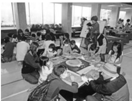
木のおもちゃで楽しむ親子

これを一つのきっかけとして、子どもたちに木の良さに気付いていただき、そして小国杉へ関心を持ってもらえることを期待しています。