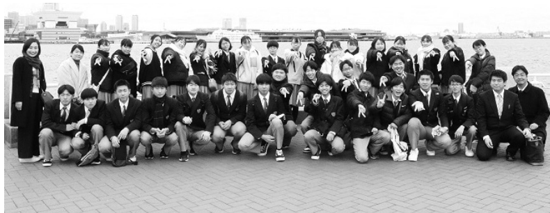
山下公園での集合写真