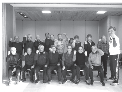
「男の筋トレ」教室参加 第1期生

町民課では、今後も、町民のみならず、健康づくりや運動のきっかけになる教室の開催や、健康づくりを継続できる体制づくりをお手伝いしていきます。