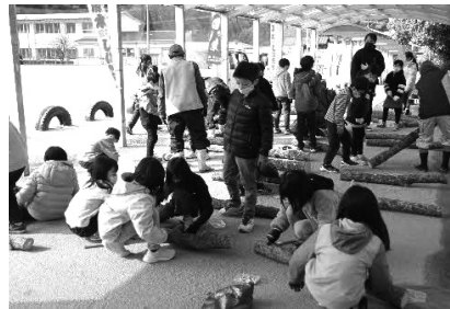
シイタケのコマうち体験