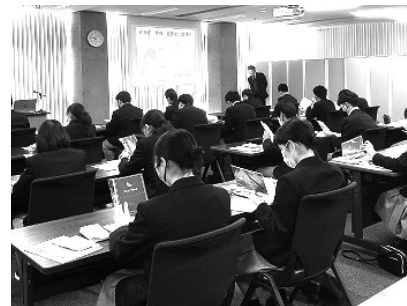
北里柴三郎氏について学ぶ生徒