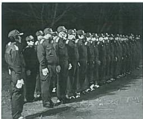
年末警戒への意気込みが伝わるきれいな整列