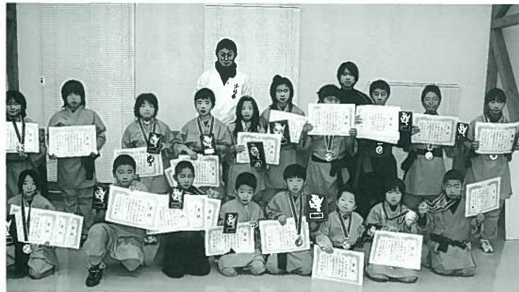
小国道場のみなさん、おめでとうございます