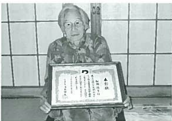
受賞おめでとうございます

蒲島県知事から、これまでの功績に対してお祝いの言葉があり、その後、知事との記念撮影が行われました。