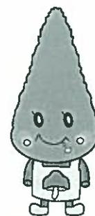
杉のっぽちゃん (デザイン：小国中生徒)