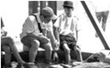
← 杖立温泉の足湯を 初体験！

5月30日(火)から約2週間に渡り、総合的な学習の時間で「小国郷で学ぼう」と題し、学校のある小国郷を通して地域についての学習を行いました。今回は小国町の杖立(温泉)をクローズアップし、その地域の特徴などを学習しました。6月7日(水)には実際に杖立に行き、温泉(今回は足湯でしたが)や蒸し場、杖立のキャラクター「杖じい」など、その魅力を十分に肌で感じてきました。その後、事前に学習したことと実際に行ってみて感じたことをまとめることで、学びを深めることができました。