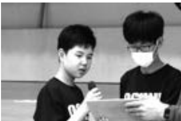
← 小国支援学校のクイズを協力して出題

今回の学習を通して互いのことを知り、協力し支えあうことの大切さを学ぶ貴重な時間となりました。