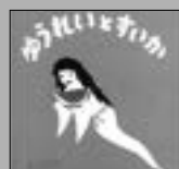
「ゆうれいとすいか」 くらだかおる：著 せなけいこ：絵 （ひかりのくに）