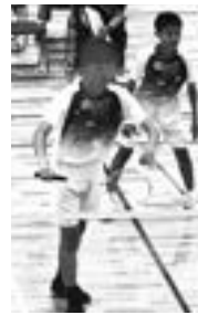
→郡市中体連バドミントン競技

本校は、南小国中とともに小国高校との連携型中高一貫校で、地域の将来を担う子どもたちの教育を中高で連携しながら様々な取組を行っています。7月10日(月)に、9年生が小国高校の体験入学に参加しました。学校紹介映像や先輩からの話、体験授業等を行いました。また、小国高生とのワークショップ形式での授業も行われ、先輩と楽しく学習に参加しました。