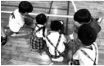
→プログラミングを学ぶ生徒と園児