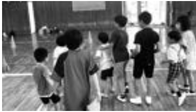
「ドローンを飛ばす生徒と園児

『プログラミング的思考』を育成すること」そして③「発達の段階に即して、コンピュータの働きを、よりよい人生や社会づくりに生かそうとする態度を涵養(かんよう)すること」の3つです。交流活動では、園児を大きく2つのグループに分けました。ボール型ロボットのグループと、ドローン型ロボットのグループです。前半と後半でグループを入れ替え、両方のロボットを体験してもらいましたが、5年生の好リードで、交流も楽しいものになりました。今後もうこうした活動を増やし、子どもたち同士のつながりをより強いものにできたらと考えています。