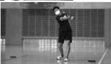
→ フロアカーリングの デモンストレーション