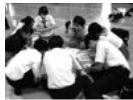
小国高校生とのワークショップ形式の授業

これから地域の将来を担う子どもたちを育成するにあたって、小中高が連携しながら、地域の子どもたちを育てること、地域の良さを最大限に活用しながら、故郷に誇りを持ち、小国から夢や希望を叶えることができる力を育成すべく、今後もしっかり取り組んでいきます。6月から7月にかけて、PTA及び生徒会主催の挨拶運動を行いました。挨拶は社会生活を営むうえで、重要なコミュニケーション力でもあります。本校では、朝や帰りに気持ちの良い挨拶が響いています。今後更に挨拶の輪を校内や地域に広げていきたいと思いをします。