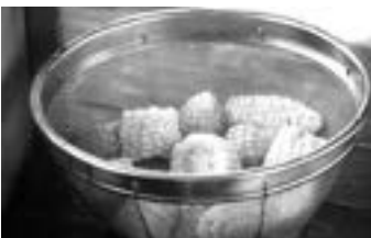
→ 杖立の蒸し場で 約10分！