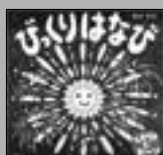
「びっくりはなび」 新井洋行（講談社）