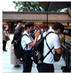
太宰府天満宮でのお参り

福岡でしかできない体験を数多く味わうことができました。イルカショーでびしょ濡れになったこと、大好きな飛行機の操縦体験をしたこと、上手にバスを運転する技術に大興奮したことで、大好きなコーヒー牛乳を飲んだこと、キッザニアでピザ作り体験をしたこと、どれも良い思い出です。ホテルの部屋でも仲良く楽しく過ごしました。