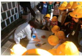
坂本善三美術館・鑑賞教室の様子

未来はますます混沌としつつあるようです。未来を生きる子どもたちに何が必要かみんなで一緒に考えていきたいと思います。