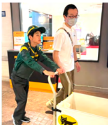
キッザニアでの職場体験