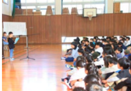
後期始業式の様子（児童意見発表）