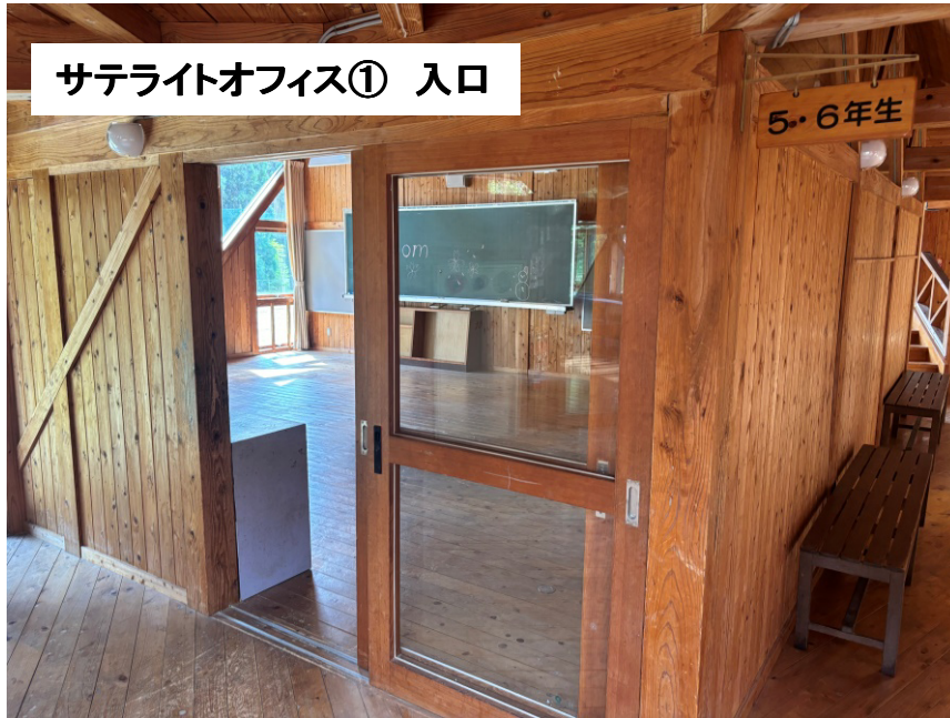
サテライトオフィス① 入口