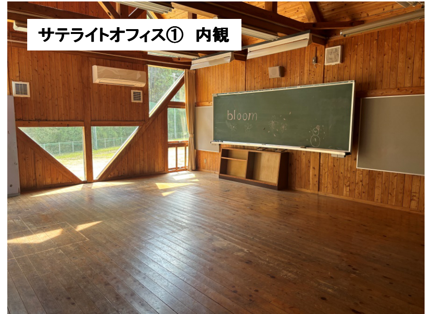
サテライトオフィス① 内観