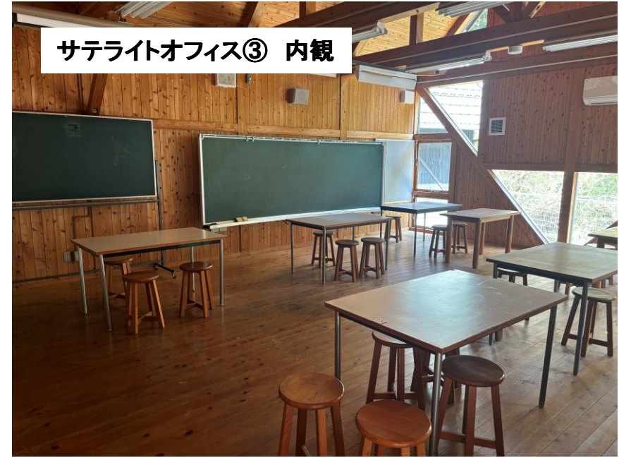
サテライトオフィス③ 内観