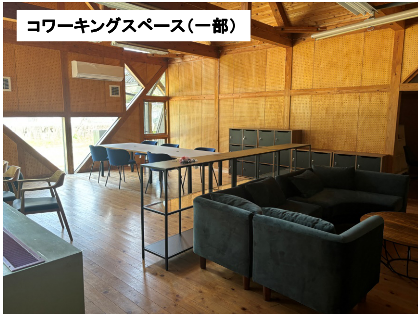
コワーキングスペース(一部)