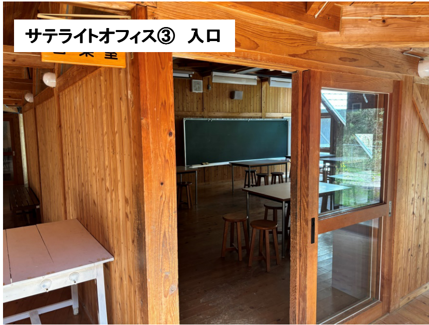
サテライトオフィス③ 入口