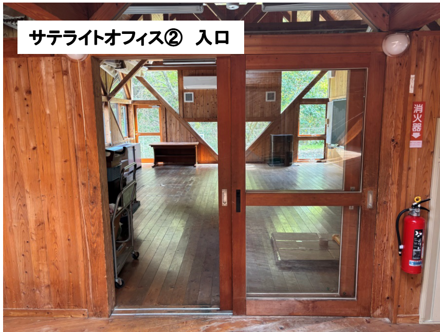
サテライトオフィス② 入口