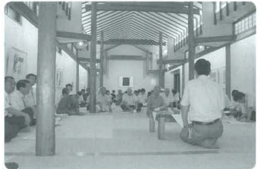
町民の生の声を聞く町政懇談会

町長就任1年目より、町民の皆様、町政について報告の場を設けると共に、皆様のご意見を拝聴する機会として「町政懇談会」を実施しました。