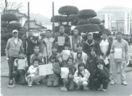
優勝した小国町チームのみなさん