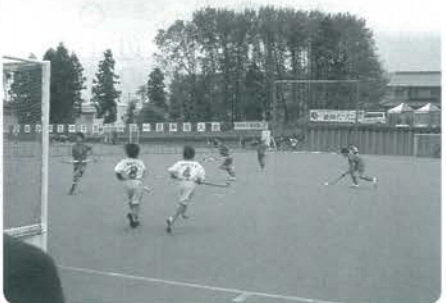
セットプレーから攻撃を仕掛ける小国町チーム

大会2日目は決勝トーナメント。1回戦は鳥上(鳥根県)と対戦しました。鳥上は選手構成も小国町と似たようなチームでしたが、攻守に上回る小国町が4対0で快勝しました。