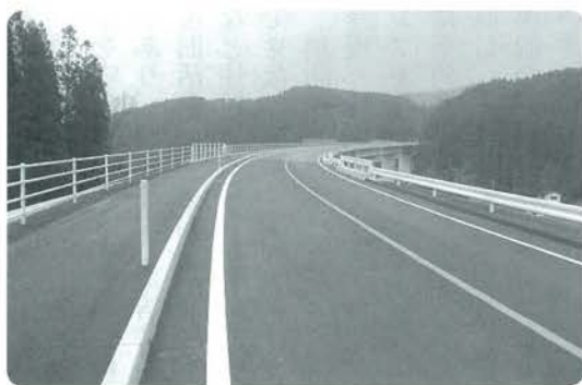
町内の国道すべてが2車線化されます（西里バイパス）