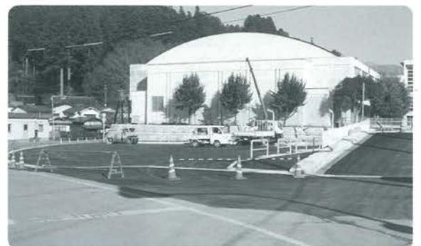
整備中のスクールバス乗降所

のであります。校区民の皆様 には、そのことをご理解いた だければと願っています。