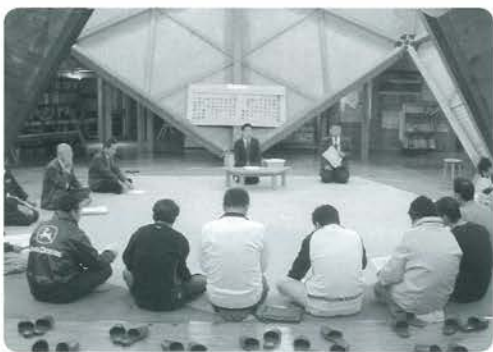
学校統廃合説明会から

新しい小国型教育は、豊か な感性と確かな基礎学力を 持った子どもたちを育ててい くという未来志向を持ったも