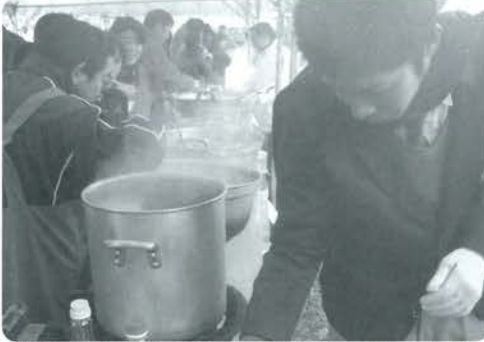
ボランティアスタッフとして手伝う小国高校生の皆さん