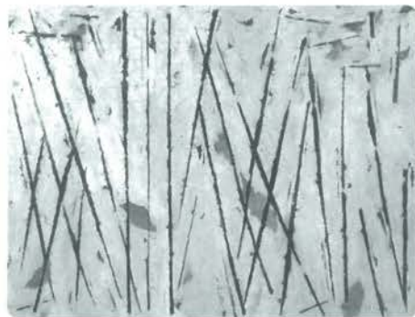
「空間へ」(画布200号展より)

て、毎年「独立展」に出品し ていました。今回の展覧会に 展示する作品も、多くは独立 展に出されたもので、その時 の自分の成果をみんなに見て もらうために全力で取り組ん だ作品です。作品の大きさが 待つ迫力、画家が全身全霊を こめて描いた作品の持つ力強 さを、たっぷりとご堪能くだ さい。