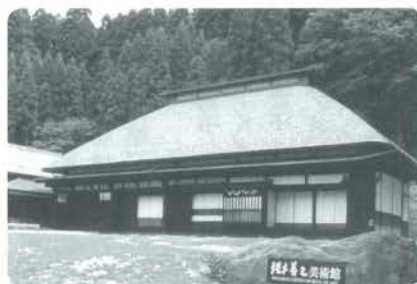
新年は美術館へどうぞ13日から開館

て、毎年「独立展」に出品し ていました。今回の展覧会に 展示する作品も、多くは独立 展に出されたもので、その時 の自分の成果をみんなに見て もらうために全力で取り組ん だ作品です。作品の大きさが 待つ迫力、画家が全身全霊を こめて描いた作品の持つ力強 さを、たっぷりとご堪能くだ さい。