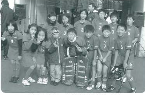
小国町スポーツ少年団のみなさん

8強入りした男子の試合を振り返ると、初日の予選リーグは、初戦でやや硬さが見られたものの春照ガッツ(滋賀県)を8対0、続く馬木スパー(鳥根県)を7対0と、いずれの試合もほとんどが相手陣内でプレーする一方的な展開で大勝。勝ち点6で予選リーグを1位で通過しました。