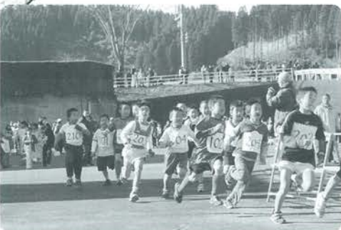
元気よくスタートする小学1・2年男子の部