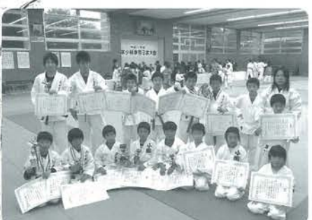
小国道場の皆さんおめでとうございます

この大会は、毎年、地元鹿児島をはじめ九州内から拳士が集まり、己の技を競い合い、武術交流する大会です。 小国道場拳士は、日頃の演武、乱取りの練習の成果を十分発揮し、すばらしい成績を収めました。 入賞者は次のとおりです(敬称略)