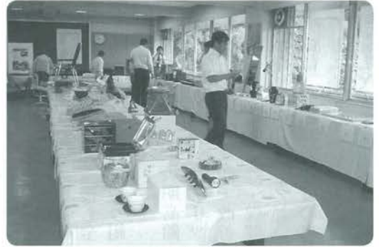
町内で行なわれた公売会

地方税徴収特別対策室は、高額・長期滞納者への搜索や、預金・自動車等の差し押さえを行います。差し押さえた財