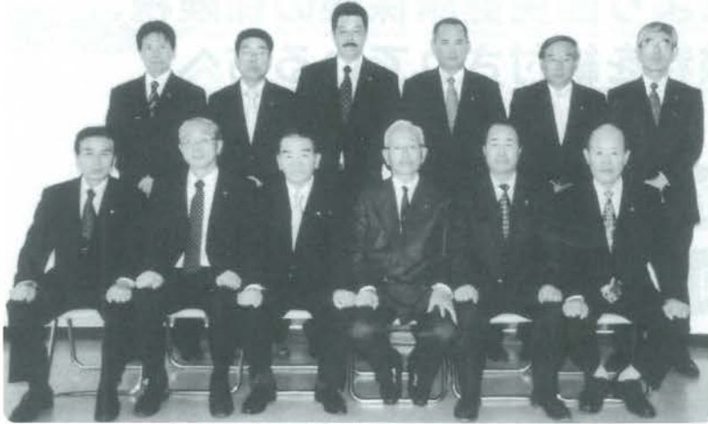
小国町議会議員のみなさん

栗山町は、全国初の議会条例を制定し、議員同士の自由討議や町民活動への参加を保障した「一般会議」の開催など、議会改革を行い、全国で最も注目を集めている地方議会です。