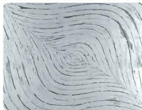
「構成」(画布200号展より)

ると丈夫ですが、材料が木と布なので、湿気を嫌います。また、極度な乾燥も木枠の反りや絵の具の亀裂を招きます。お風呂の脱衣所などの湿気の多い場所や、直射日光の当たる場所に飾るのは避けたほうがよいです。また、麻の荒い布目にほこりがたまりやすく、それがカビの原因にも