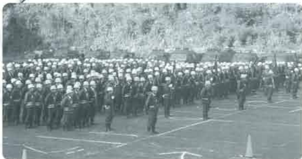
整列する小国町消防団