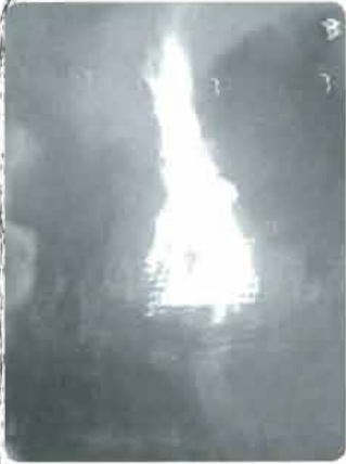
勢いよく燃え上がる炎

が作られ、下城小児童らが火打ち石で起こした火で点火、炎は勢いよく燃え上がり、渓谷にこだまする「パン、パン」と竹を弾く音が気持ちよく感じられました。また、川面には、燃え上がる炎が映し出され、幻想的な光景に、浴衣姿の観光客も振る舞いのせんざいや、かつほ酒を味わいながら、湯の町杖立を楽しんでいる様子でした。 「九州三湯物語」の2009年のスタートは、杖立温泉「どんどや」で、観光発展の火が灯されました。