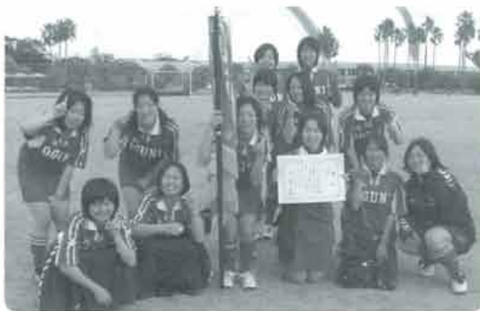
優勝おめでとうございます