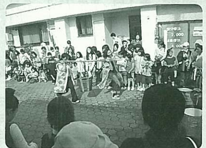
お湯かきレースの様子

商店街の道路を貸し切って行われた箸にお湯を入れてリレーする「お湯かきレース」には、由布院の各地区から参加があり、大いににぎわいました。由布院とい