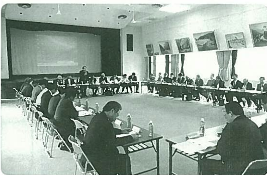
小国郷地域公共交通会議の様子

この会議は年に数回開催され、今年一年間は小国郷地域の実情にあつた交通計画を作成するために、住民アンケート調査や現地調査を行っていきます。そして来年度からこの計画を基礎として実際に運行実験を行う予定です。今回、会議の会長に選任さ