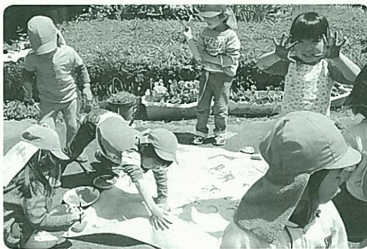
楽しそうに絵を描く蓬萊保育園の園児