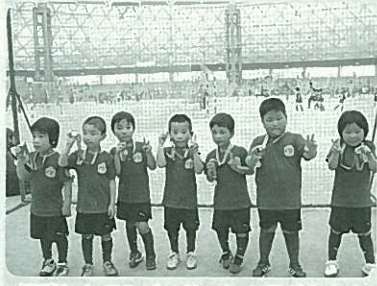
優勝したFCバッサレの子どもたち

5月3日(日)、熊本市パークドームで、2009キッズユニアサッカー大会新人戦がありました。小国町からは、FCバッサレクラブに所属する就学前年中組・年長組、小学1年生、小学2年生(2チーム)、小学3年生の合計6チームが参戦しました。サッカーボールを追いかける可愛い勇姿に、応援に来た保護者も熱心に声援を送っていました。中でも、予選で2勝