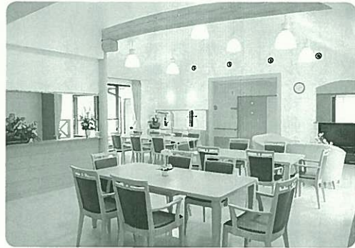
内装に小国杉を使用

を受け、現地を訪れ、緑の森、澄みきった空を見たとともに、高齢者の理想郷を築きたいと思った。町から提