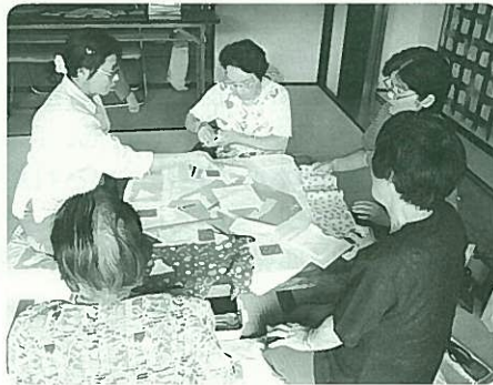
教室ネットワークの様子

生活をちよつと可愛らしく素敵に彩るカントリー雑貨をツールペイントで作ります。初心者大歓迎。