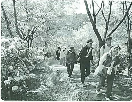
上田名原の山荘「都離美庵」

小国ドームをスタート、ゴールとする3つのステージがあり、9日は西洋シャクナゲ満開の上田名原の山荘・都離美庵から木魂館に向かい昼食、ここで、北里育才舎が特製の豚汁を定価の3分の1程度で販売、参加者も舌鼓の様子でした。その後、旧国鉄宮原線遊歩道など15キロを元気に完歩しました。