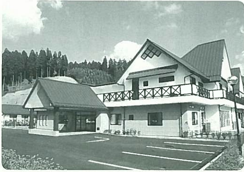
帝国ホテルをモチーフにした美しい外観

を受け、現地を訪れ、緑の森、澄みきった空を見たとともに、高齢者の理想郷を築きたいと思った。町から提