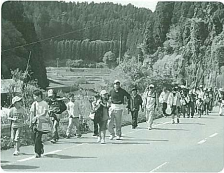
参加者のみなさん

参加者のアンケートでは、「新緑が気持ちよく、楽しかった。滝がきれいだった」「宮原線遊歩道は、トンネルや鉄