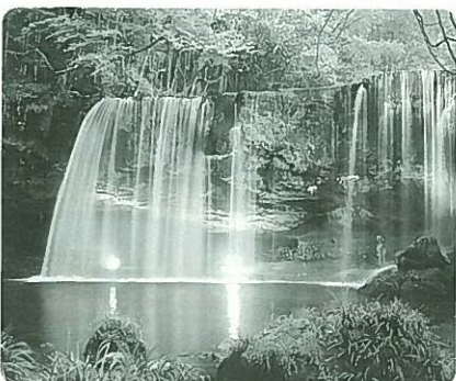
幻想的に浮かびあがる鍋ヶ滝

ゴールデンウィークの貴重な休暇期間ですが、『鍋ヶ滝は、地域の観光名所、いろんな形でPRしたい』という