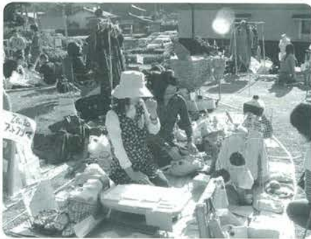
賑わうアートフリマ

具体的には、坂本善三美術館本館の一部を軽微な改装し、展示スペースやアトリエとして自由に使える「町民ギャラリー（仮）」が今年誕生する予定です。