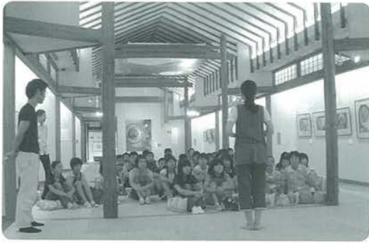
美術に親しむ小学生鑑賞会

子どもから大人まで広く美術に親しんでもらえるよう、鑑賞や制作の体験の場を提供しています。教育普及活動には大きく二つの柱があつて、一つは学校対象、もうひとつは一般対象です。