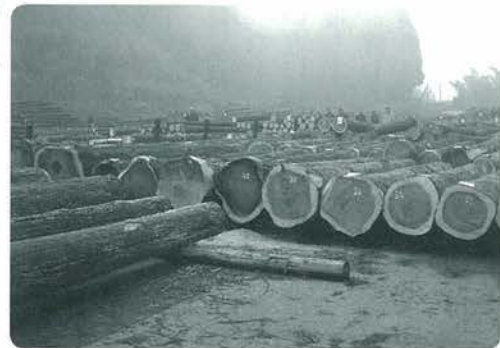
ズラリと並んだ優良材