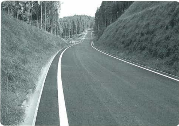
整備が進む基幹農林道