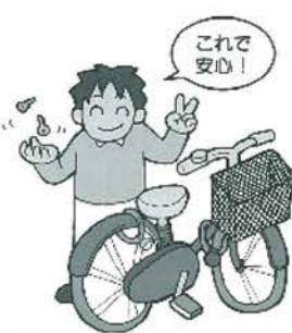
愛鍵～あいじょう～ 2つツーロック!

罪種としては、万引き、乗物盗、車上ねらいが多く発生しています。 乗物盗、車上ねらいについては依然として無施設時における被害が多く、また、万引きについては少年による行為が増加しています。