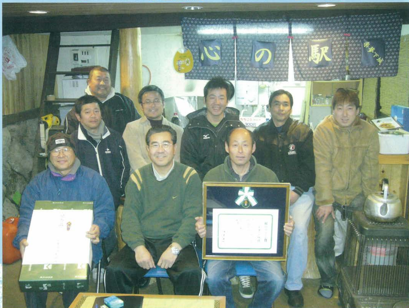
「楽夢下城」のみなさん