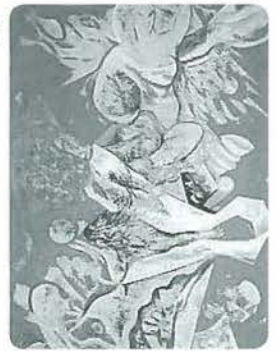
「花の精」善三先生26才の作品

中でも代表的なのは、「花の精」です。この作品は数年前に、善三先生のアトリエに残されていることがわかり、おとし善三美術館で初公開された作品です。鮮やかな水色の背景に白い女性像が浮かび、それにまとわりつくように布のようなものや植物のようなもの漂っているという絵です。「花の精」と言っても具体的に花は描かれていません。描かれているのはむしろかしたら、花の中に住まう花の精の様子、つまり花の命のようなものなのかも知れませ