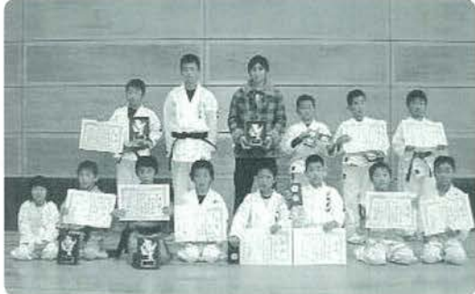
受賞おめでとうございます