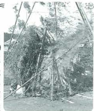
勢いよく燃える竹やぐら