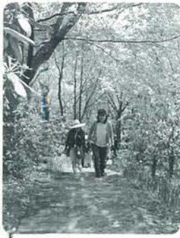
満開のシャクナゲがお出迎え

4月27日、満開のシャクナゲを見てもらおうと、「森のシンフォニー・シャクナゲ祭りハイキング」が開催されました(主催:北里育才舎・共催:(財)学びやの里) 今年で3回目となるこのハイキングには、ラジオを聴いたり、新聞を読んだりなどで、長崎県佐世保市、福岡県八女市、熊本市、宇土市など町外