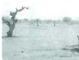
砂漠化が進むサヘル地域 (地球環境キーワード事典)