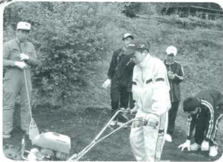
農園にふれる中学生たち

5月13日から15日まで、北九州市立大谷中学校2年生109名が、本年度第一回目として町内29家族の元で農村体験を行いました。酪農家で初めて搾乳を体験する子や田植えの体験をする子など参加した生徒に緊張や喜びをもたらしたようです。 受け入れ家庭との対面では、不安顔の生徒たちもお別れ式では涙を流す姿もみら