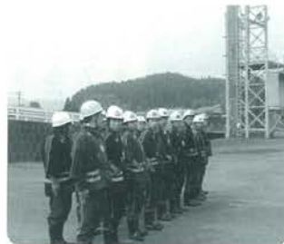
通常点検を行う訓練生

4月27日、消防団員初任科訓練が広域消防北部分署で行われ、訓練には、本年度入団した新入団員ら18名が参加し