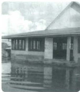
国土の浸水ツバル（満潮時）

この干ばつと気温の上昇で農作物にも影響がでます。小麦やトウモロコシなど重要な生産地である中国やインドで大幅な生産量の減少が見込まれます。特に、海外に食料の約6割を依存する日本にとっては影響が大きいと考えられます。