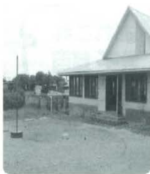
国土の浸水ツバル（干潮時）

気温の上昇により氷河が溶け出したり海水温の上昇による海水の膨張などで海面が上昇し、インド洋にある「モルディブ諸島」や南太平洋にある「ツバル」などの海拔の低い島々では島全体が水没してしまう恐れがあります。日本でも海面が1m上昇すれば9割の美しい砂浜が消失したり、大阪や東京の海岸地帯の