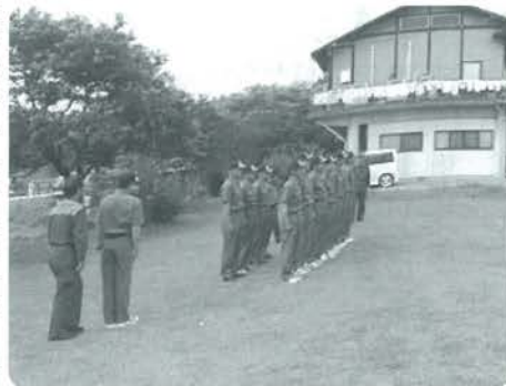
隊列への厳正な号令