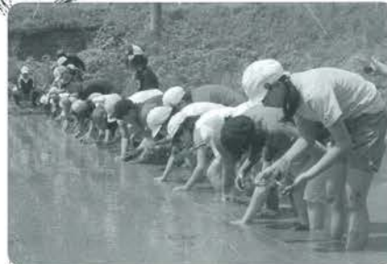
真直ぐ並んで植えていきます

5月30日、黒淵古屋で蓬萊小学校の3年生以上の36名が、田植え歌にあわせてもち米の苗を植えました。