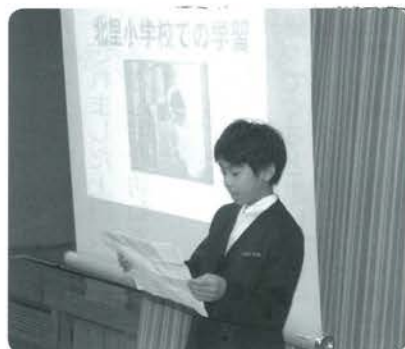
発表する北里小の児童