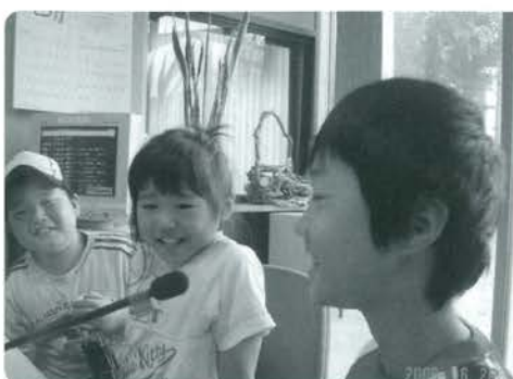
西里小学校3年生の皆さん

スタジオにはこういった見学の子どもたちが度々やってきてくれるのですが、今回は見学者が少人数でスタッフにも少し時間があつたので、特別に番組出演もしてもらいました。番組中に「ラジオは聞いたことある?」とたずねると全員