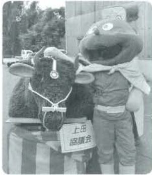
各大字による作り物も見所の一つ