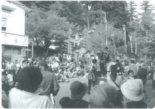
賑わいを見せた抽選会