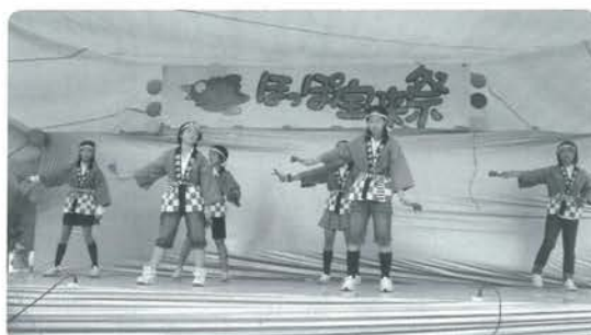
蓬萊小児童の踊り

あいにくの雨の中の開催でしたが、終盤には雨も上がり、大盛況のうちに終了しました。