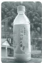
配布された 「べっぴん愛」

「杖立べっぴん会」は、温泉落語の来場者に微生物を元気にする液体「べっぴん愛」を入れて配布しました。この液体は、家庭排水に流すことで、微生物が活動し、又メリガとれ、悪臭も消えるそうので、環境浄化の取り組みの一つです。 落語を聞ききたみなさんに、環境問題のPRになったことでしょうか。