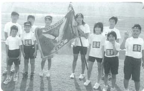
優勝旗を手に蓬萊小リレーチームのみなさん