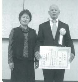
受賞おめでとうございます

初日は技術交流会を中心に、原木椎茸の生産・販売の将来展望や課題について事例発表と質疑応答で交流会が行なわれました。