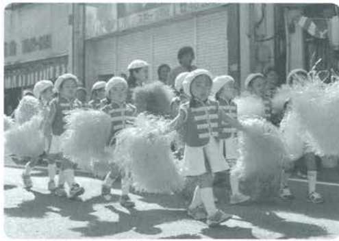
かわいらしい踊りを見せてくれました