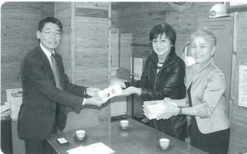
いのちの大切さをしっかり感じてください