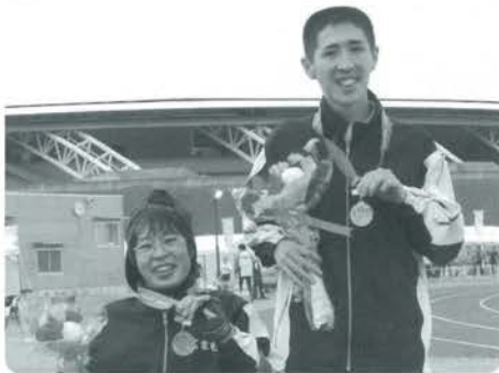
メダルを胸に長さんと中嶋さん