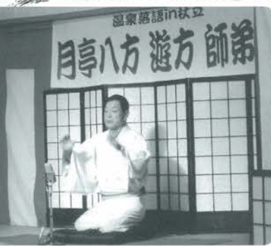
月亭八方師匠の落語に会場は笑いにつつまれました