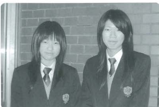
5代目高校生りポーターのお2人