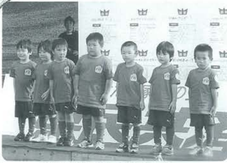
見事優勝の年中の部イレブン

11月1日、合志市の農業公園カントリーパークにおいて「第5回県民共済カップTKUキッズサッカー大会」が行われ、小国町から出場したFCバツサーレ（河津豊代表）が好成績をおさめました。 この日は、年長と年中の部の試合があり、年長の部が3位、年中の部は見事、優勝を飾りました。優勝した年中の部は、初戦こそ引き分けでしたが、子供たちは試合を重ねることに上手になり、最後の試合では3対0と相手を寄せ付けぬ強さで勝利をおさめました。 また、11月2〜3日は、同じく農業公園カントリーパークで「2008丸美屋お城納豆カップTKUジュニアサッカーフェスティバル」が行われました。