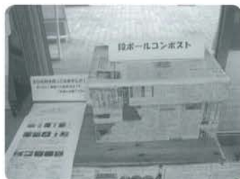
手軽に堆肥化してみませんか