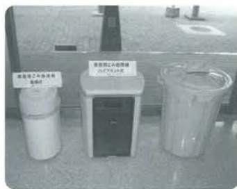
生ごみ処理機を展示しています