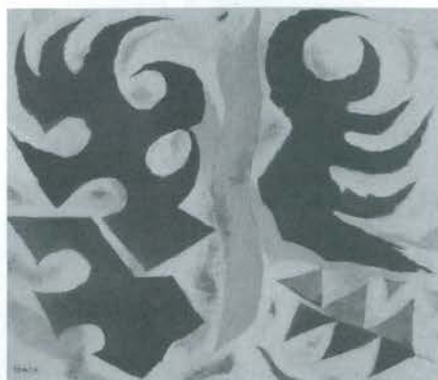
友の会から寄贈された作品「炎」

寄贈された作品は坂本善三美術館に収蔵され、現在展示棟奥の小展示室でお披露目しています。ぜひご覧ください。