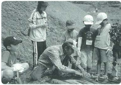
自然学校から。農業体験

これまでの全農家を対象とし、品目毎の価格に着目して講じてきた対策を、担い手に対象を絞り、経営全体に着目した対策に転換するものです。また同時に、農地・農業用水等の資源の保全管理のための地域ぐるみでの高い共同活動と、農業者全体での先進的な営農活動を支援する目的で「農地・水・環境保全向上