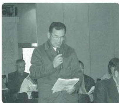
活発な意見が出された教育フォーラム