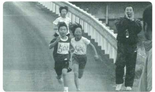
ゴール前のデッドヒート