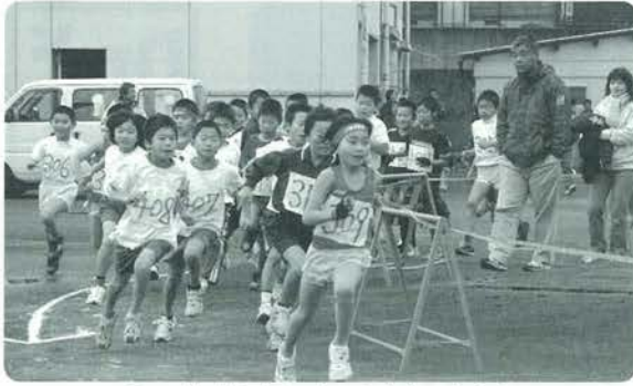
3・4年生男子スタート直後のようす