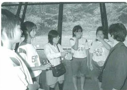
うるるん体験教育でのお別れ会。思わずこみ上げるものが

ここ数年の気象変動で農産物の生産高は厳しい状況が続きます。米も作況指数は89%でした。高冷地野菜の出荷量も減少しています。そんな中きゅうりは生産量は少なかったものの販売高が去年を大きく上