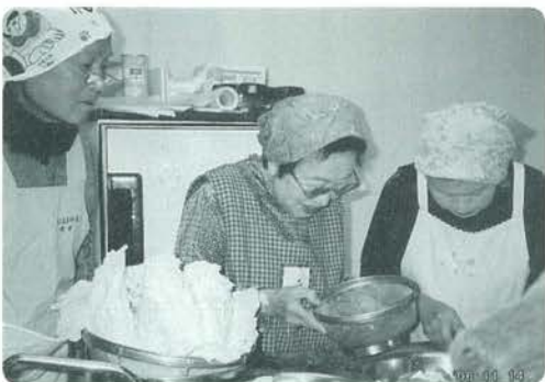
高齢者「生き生きサロン」から

また健康の維持増進や介護予防のための施策の充実に取り組んでいく必要があります。昨年、地域で暮らす高齢の皆さんを、介護、福祉、健康、