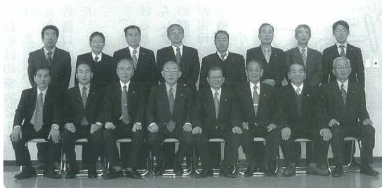
小国町議会議員の皆さん

一昨年、小国町を襲った豪雨災害の復旧工事も順調に進み、農地・農業用施設や河川・道路・橋梁の公共土木施設災害復旧事業等、現在約80%の