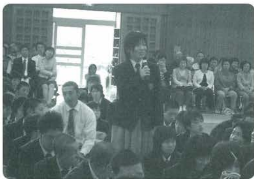
中高一貫講演会から 意見発表する小国高校生徒

少子化で児童生徒数が少なくなっている中で小国型教育を考えます。学校統廃合についてもしっかりと議論を重ねなければなりません。小国型教育の目標は、ふるさと「おぐに」を愛する、ふるさとの「におい」を忘れない子どもたちを育てることです。そしてこの目標に向けて、2つの基本方針を立てました。一つは「豊かな自然環境を活かし