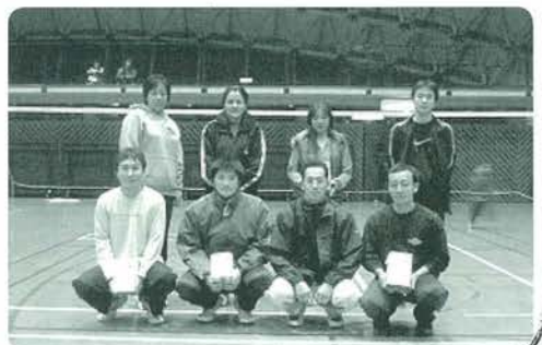
各パート優勝の皆さん