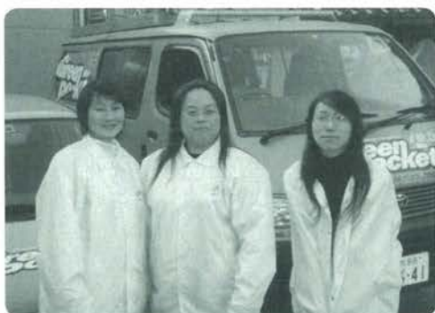
今年もよろしくお祈りします

災害は忘れた頃にやっつき ます。せっかく育てた森林も 山林火災、雪害等で崩壊して しまいます。万が一の為に森 林国営保険に入りましょう。 詳しくは小国町森林組合(川 谷)までご連絡ください。