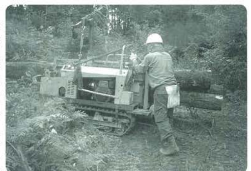
木材の切り出し作業

一方既存の製材工場、販売店から直接都市の工務店とかハウスメーカー、設計業者等への販路を切り開いていくことです。木造建築群で築いて