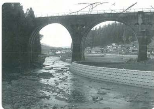
きれいに整備された護岸

小国町に甚大な被害をもたらした平成17年の集中豪雨の災害復旧が順調に進んでいます。町の発注はすべて終年度内の工事完了に向け全力で取り組んでいます。流木や大きい石などが散乱していた河川沿いの田畑も秋の実りを見せました。