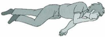
意識がないときは回復体位にして救急車の到着を待ちましょう。

みなさんで楽しいお酒の席にしましょう。もしも、急性アルコール中毒を疑うようでしたら、すぐに救急車を呼んでください。