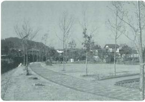
六花園は若者の待ち合わせの場所

湧蓋山麓温泉郷の岳湯、はげの湯、山川は近郊の日本一のつり橋の影響もあり観光客が増加しています。このチャンスをつかんで、将来に向けての価値の高い永続する観光地作りをして欲しいです。それは料理の価値であったり、マナーの良さであったり、訪れる人たちが求めているものを大事にしていくことです。高原の景観の美しさや地域のあちらこちらから蒸気が噴出している風情の楽しさもありますが、この機会に今まで以上に研修等も重ねて学ぶことが必要です。