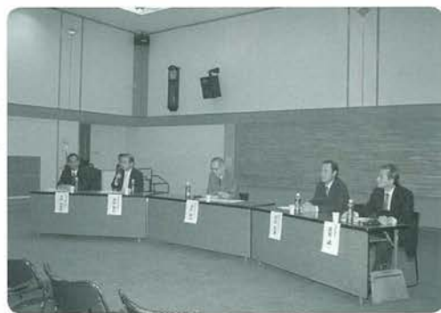
教育フォーラムから

ないことです。これは学校教育だけの問題ではなく家庭はもちろんのこと地域社会全体で考えていかなければならないと思います。 昨年第1回の小国型教育を考えるフォーラムを開催しました。今後もこのフォーラムを開催していきますので、より多くの皆様に参加してもらい、貴重なご意見を頂きよりよい小国型教育を目指していきます。