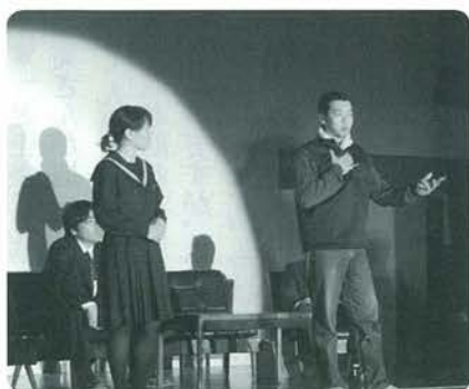
熱い思いを伝えたい