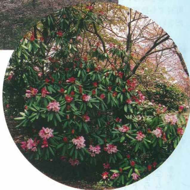
シャクナゲの花期：4月中旬～5月中旬