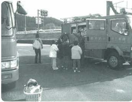
熱心に説明を受ける小学生

北部分署管内の小学生が社会科見学に来署しました。消防署のしくみや119番の受信のしくみを勉強しました。また、消防車に乗りいろいろな積載器具の説明を受け、実際にホースを伸ばして放水も体験しました。