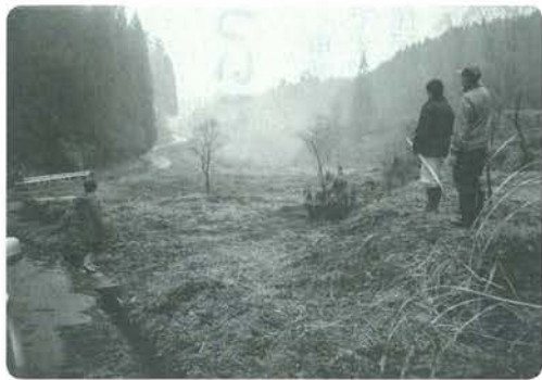
転用許可後現地確認

こともあつて、農地（農用地区域外）は、相当程度の荒廃が進みつつあります。セイタカアワダチ草等の雑草が広範囲に繁茂した状態もあり、このままでは、農地としての維持・機能が果たせない土地が増えてくるような地域も見受けられました。こうした地域には、農地の転用等を進める一方、遊休農地の解消活動について、農業委員会が各農家等への呼びかけを行うことになっています。