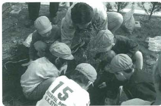
山東保育園の園児たちと交流

電線近くの作業にご注意! 伐採作業中の倒木により停電事故が多発しています。電線近くでの伐採作業は、十分注意して下さい。切れた電線は非常に危険ですので絶対に触れないで下さい。 電線近くでの伐採作業を行う場合は必ず九州電力までご連絡下さい。