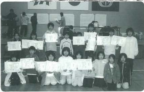
おめでとう蓬萊小、西里小のみなさん

り広げられました。特に今回の大会では、4年生女子が活躍し、シングルス・ダブルスともに入賞を独占しました。