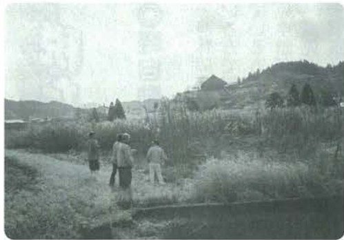
遊休化した農地の確認

小国町農業委員会では遊休農地の実態把握と発生防止・解消対策、農地の無断転用防止対策等のために、管内の優良農用地区域や、住宅地周辺地域における遊休農地（耕作放棄地）のパトロールを、2月6日と9日の両日実施しました。パトロールは、大字単位に分かれて行いましたが、中山間地域直接支払制度の取り組みや、水田転作の実施で比較的遊休農地（耕作放棄地）は少ない状況でした。