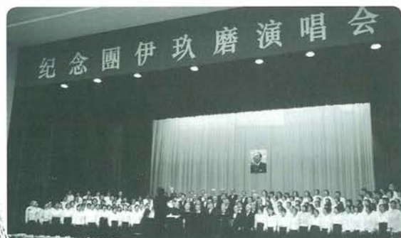
中国蘇州市での公演。200人の合唱