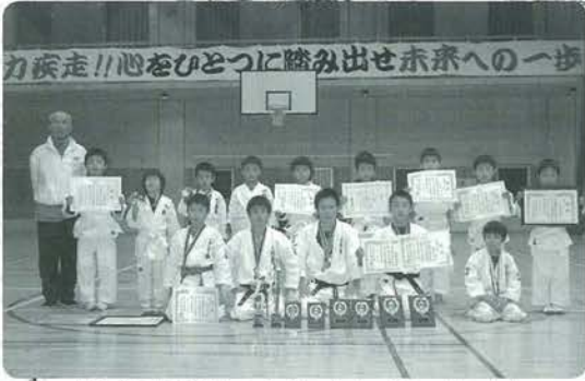
少林武術小国道場のみなさん おめでとうございます

平成18年12月17日、玉名市総合体育館で「第7回日本少林武術祭」(大会)が開催されました。