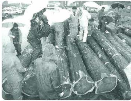
活気あふれた優良材市