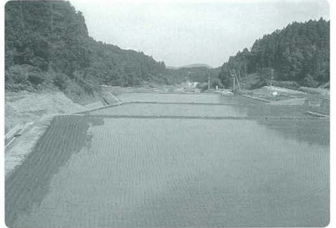
区画整理された万成工区