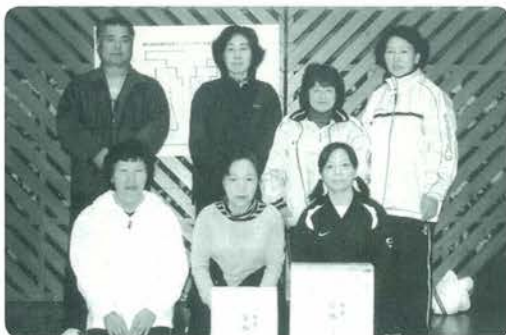
優勝のメルトモミックスのみなさん