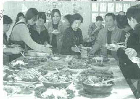
いろいろな料理が作られました