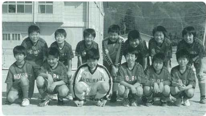
蓬萊小サッカーチームのみなさん

最後にPK戦で勝利しました。残念ながら3回戦で0-5で坂梨小に負けベスト8で終わりました。体格差もあり全試合厳しい試合でしたが、子どもたちのやる気やいい結果を残せました。6年生にとっては良い思い出になったと思います。北里小も粘り強いゲームでベスト8に進みました。蓬萊小、北里小の選手の皆様、おめでとうござ