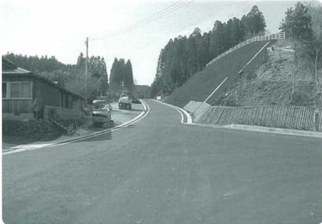
整備が進む基幹農林道

これまで基幹農林道総延長14・9kmの内、約50%を暫定整備し、区画整理93haについては、9割以上完了しております。本年度、基幹農林道は、橋梁建設を中心に残りの区間の建設を行い、区画整理については万成工区、並びに戸角地区の水路、尾園のため池の整備を予定しております。 工事期間中は住民の皆様にご迷惑をおかけしますがご協力よろしくお願います。