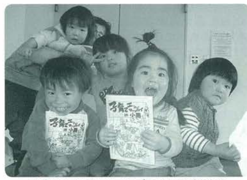
子育てエンジョイマップを手に子どもたち

を知りたい」と感じているお父さん、お母さんはいませんか?そんな皆さんの声からこの度『子育てエンジョイマップinおぐに』が出来ました。 『子育てエンジョイマップinおぐに』は、現在子育て中のお母さんたちが情報収集から印刷製本まで自分たちで行った手作りの小冊子です。町内で開催されている子育て支援活動の紹介や、子どもを連れておでかけできるスポーツやお店が掲載されています。表紙はピンク、絵は制作に参加している子どものお父さんの手書きです。とてもか