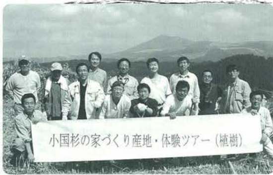
産地ツアー植樹参加のみなさん

3月24日、25日の両日、小国スギ産地ツアーが行われ、熊本市などから消費者約30人が参加しました。全国の森林組合で二番目にSGEC（緑の循環認証