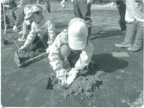
豊かな緑に育ってね

当日は、好天にも恵まれ、蓬萊小学校の児童・先生、地域の方々のほか、森林関係者など約120名の参加者が、五百本の幼木（ケヤキ、カツラ、コナラ、オニグルミ、アカガシ、タブノキ）を植栽しました。