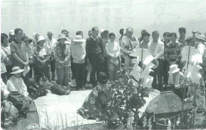
山頂で神事が行われました

5月27日(日)、小国富士の愛称で親しまれている湧蓋山山開きに併せて春のファミリーハイキングが開催されました。早朝から参加者が集い、それぞれのペースで山頂(1500M)を目指しました。好天に恵まれ、初夏を感じさせる心地よい青空の下、久住連山や阿蘇五岳が一望できるすばらしい景観の中で楽しみながらの昼食は参加した人たちに格別のプレゼントとなりました。