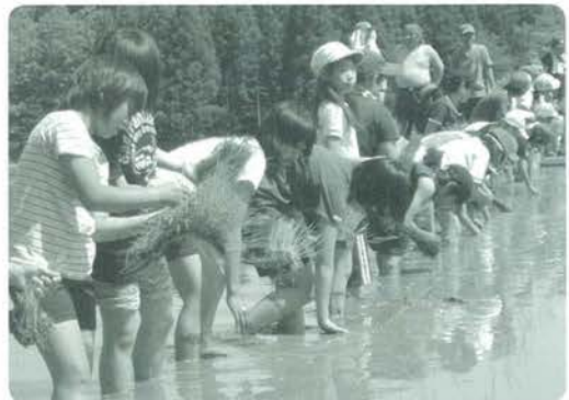
田植え歌にあわせて田植

5月24日、保護者の方々と一緒に田植えを行いました。昨年度から地域に伝わる田植え歌を老人会の方に歌っていただき行っています。歌にあわせて「はいはい」という元気のよい子どもたちの合いの手とともに楽しく田植えすることができました。秋にはたくさんの実りがあるといいですね。