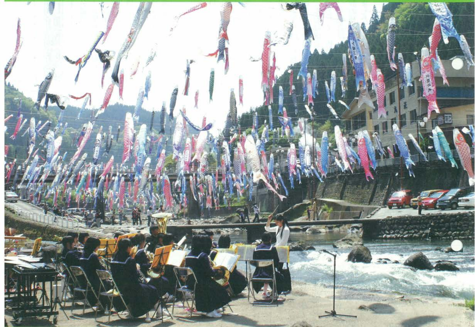
杖立温泉鯉のぼり祭