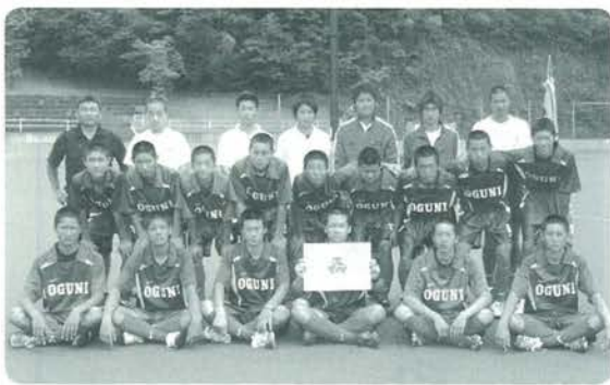
小国高校男子ホッケー部

6月16日から18日までの3日間、鹿児島県の樋脇川薩清修館高校で沖縄県、佐賀県（全国総体開催地）を除く九州各県の代表校男女12チームが参加し、佐賀インターハイの出場権（上位3校）を懸け、九州地区予選会が開催されました。初日は予選リーグ12試合が行われ、小国高校は男女ともに1位で突破し、準決勝へと駒を進めました。大会2日目、全国