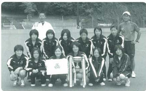
小国高校女子ホッケー部