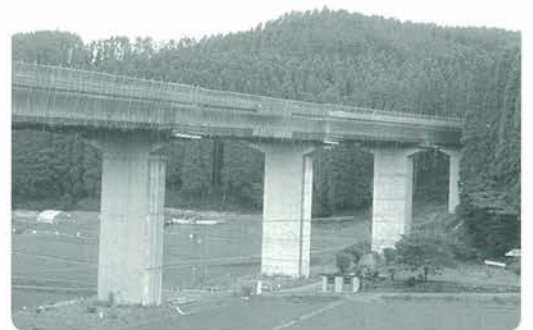
改良が進む国道387号網の田地区

町道の改良につきまして、若宮片田戸角線の改良舗装が完了しつつありますが、まだ数路線大規模改良を必要とする路線があります。しかしながら現在の財政の状況では、着手までにもう少し時間を必要としています。