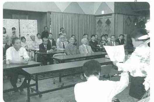
発表する北里小の児童