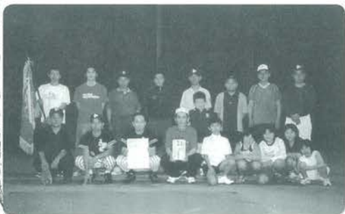
C ランク優勝 西三マケシラーズ

は、降雨のため大会が順延されたことも影響し、棄権試合が5試合あり残念でしたが、各ランクの決勝では、予選リーグとは逆に、力の差があり大差で決着がつかしました。