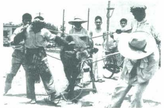
ジャージー牛は導入50周年（昭和32年の写真）

平成18年度も、気象や諸状況の変動のなか、野菜類の販売額は依然厳しいものがありました。今後も、価格上昇はなかなか望めない状況にあると考えられますが、新規野菜の導入や、高齢者も作りやすい農産物への取り組みなども視野に入れた検討を進めていきます。さらに、農業教育体験など交流事業をすすめることによる、農村の活性化にも取り組んでいきます。