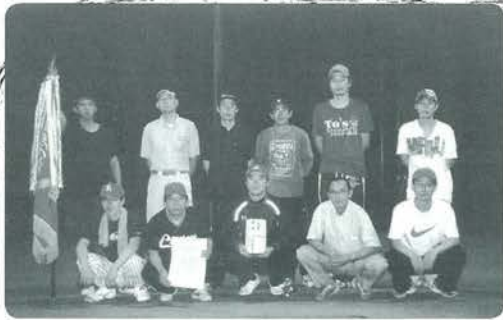
A ランク優勝 黒一スリーセブン

3チームによる予選リーグでは、勝率が同率のところが多く、得失点差により決勝トーナメント進出が決定しました。3連覇を目指した殿町オカリヤーズも残念ながら予選リーグで姿を消しました。一方、決勝トーナメントで