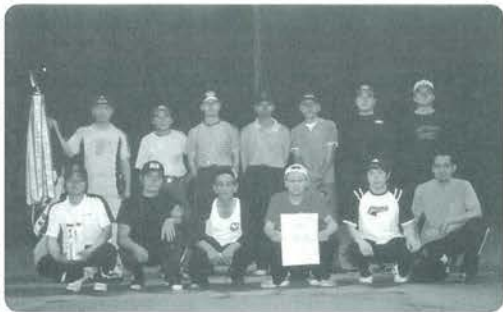
B ランク優勝 下三クラブ