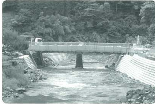
災害復旧工事が進む尻江田地区

筑後川の源流に位置する小国町は豊かな自然環境に恵まれ、多くの観光客、来訪者を惹きつける町の重要な財産で