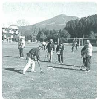
白熱するグランドゴルフ大会

木魂館を主会場に開催される小国音楽祭は、H19年度で18回目を開催し、文化の向上に貢献。また、町内の高齢者の健康づくりを目的に「木魂館杯グランドゴルフ大会」も開催しています（11月で5回）。