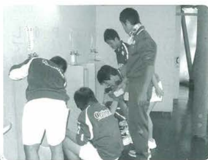
真剣に取り組む生徒たち

の、トイレ掃除でしたが、生徒たちは一生懸命取り組み、終わった時はみな満足した表情でした。