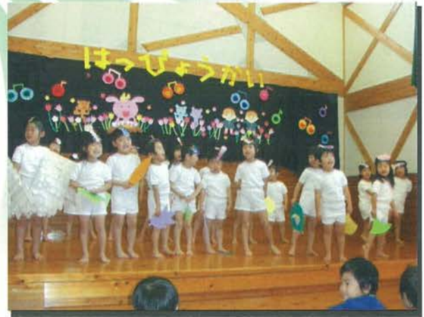
(北里保育園発表会)