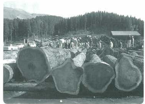
小国郷優良材市から