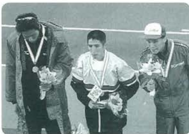
おめでとうございます