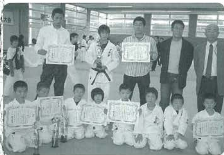
2部門を制した小国道場のみなさん