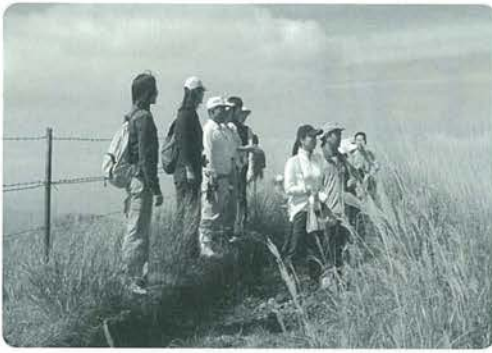
ワークショップの様様

都市の中学生が町内農家に泊まりこみで農林業体験学習を行う「うるるん体験教育ツーリズム」もその一つ。平成17年度2校の受入からスタートし、平成19年度は6校約900人を受け入れられました。毎回、受入れを行って頂