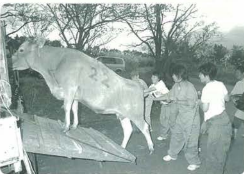
うるるん。畜産農家での様子