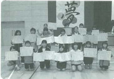
入賞おめでとうございます