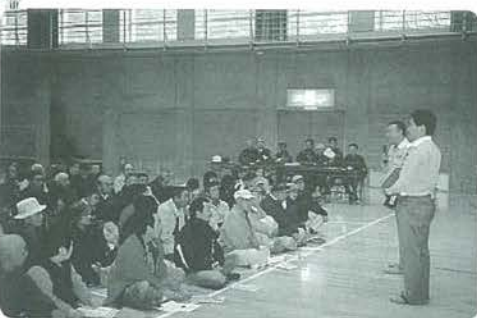
消防署員による説明会