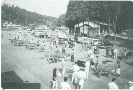
丹精こめて育てた牛が勢揃い

生産者の皆さんが丹精込めて育てた牛が両町合わせて94頭出品され、肉用種・乳用種合わせて9部門で審査が行われました。乳用種については11月に栃木県で開催される全国ジャージー共進会の候補選定もかねて実施しました。審査の結果名誉賞主席は次のとおりです。(敬称略)