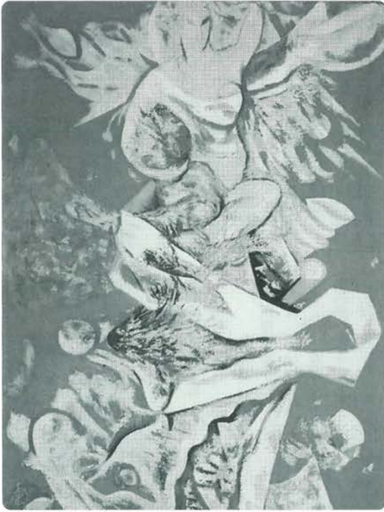
初公開される「花の精」 1937年 油彩

担う美術館は今以上の努力が必要と想っています。小国町民の皆様にご理解と御協力を願います。次