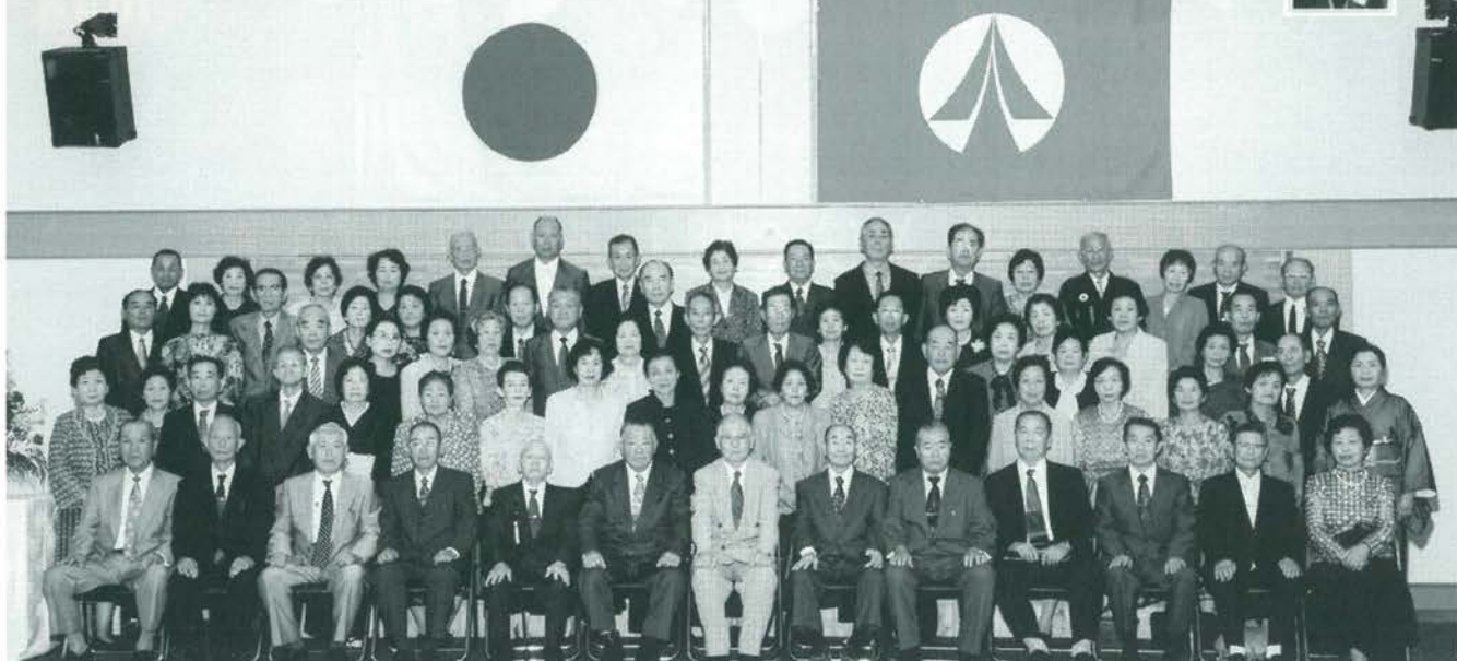
第47回 小国町金婚夫婦表彰式