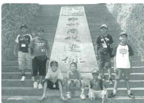
あこがれの少林寺。羽ばたけ拳士たち