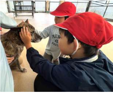
犬に触ってみた！（1年生）