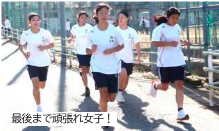
最後まで頑張れ女子！