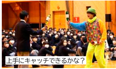
上手にキャッチできるかな？

3校の生徒が感動を分かち合い、芸術の持つ力を改めて感じる貴重な機会でした。今後も交流を通して、感性を磨き、豊かな心を育んでいきます。