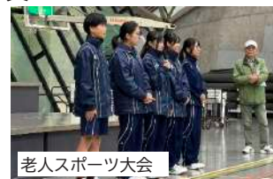
老人スポーツ大会

11月9日（日）小国町老人スポーツ大会が行われ、ボランテニアとして5名の生徒が参加しました。準備運動やフオークダンスを楽しみ、競技の補助をしました。「地域の高齢者との交流が少ないので増やしたい」との生徒会の思いから参加させていただきましたが、中学生も交流を深めるいい機会でした。