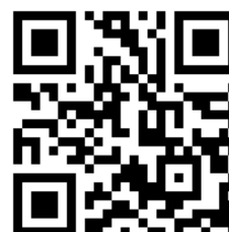
FMおぐに公式ライン