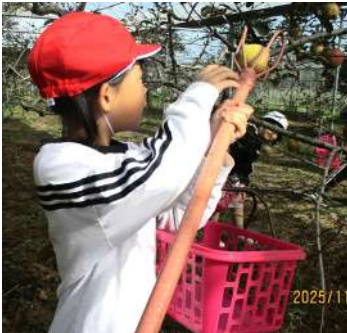
上手に採れるかな？（2年生）

不思議なことに、みんなと見聞きし、体験すると新しい発見があり、できるようになることが増えます。とても貴重な時間となりました。