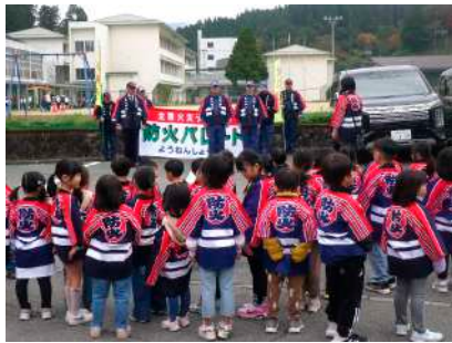
宮原保育園児達による 防火パレードの様子