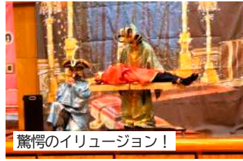
驚愕のイリュージョン！

興会による「TO KYO スーパーイリュージョン」は光と音に包まれた迫力あるステージで、驚きと歓声に包まれ、あつという間のひと時でした。