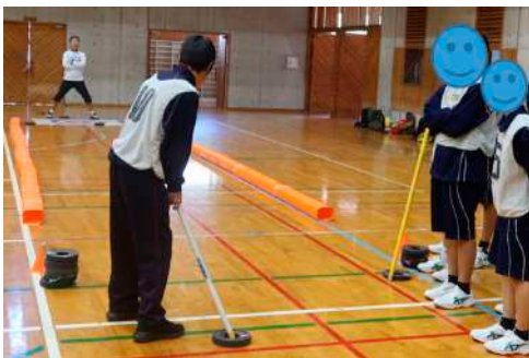
上手く飛ばせるかな！？

の活動を通して小国中学校の生徒と友達になることができ、とても充実した時間でした。