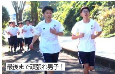
最後まで頑張れ男子！

当日は、育志会の皆さまに交通指導や補食の準備など、大きなご協力をいただきました。また、地域の皆さまから温かい声援をいただき、生徒たちの力になりました。皆さまのおかげで、安全で充実した大会を実施することができました。心より感謝申し上げます。