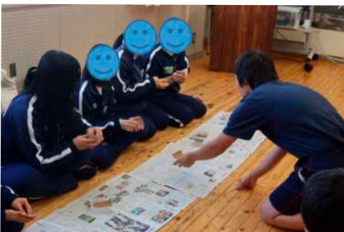
教えてもらいながら作業中！

高等部の生徒が小国高校の生徒に作り方を教えたり、製品の出来栄を一緒に確認したりするうちに、少しずつ会話も増えていきました。50分間という短い時間でしたが、最後には別れを名残惜しそうにする姿も見られ、心あたたまる交流となりました。