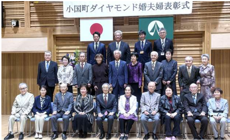
小国町ダイヤモンド婚夫婦表彰式

結婚60周年を祝う「小国町ダイヤモンド婚夫婦表彰式」が10月22日（水）、おぐに町民センターで行なわれました。