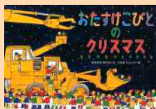
「おたすけびとのクリスマス」 なかがわ ちひろ：文 ヨコセ・ジュンジ：絵 (徳間書店)