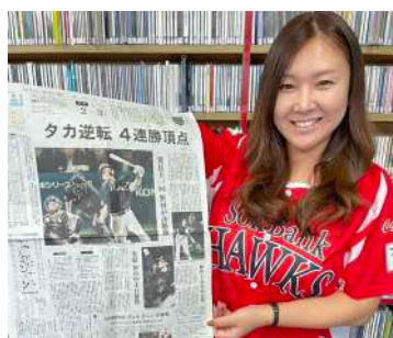
チア・ホークス担当のたっきー

「チア・ホークスはタイミングが合わず・聞けていないが、知り合いも気になると言っていた」