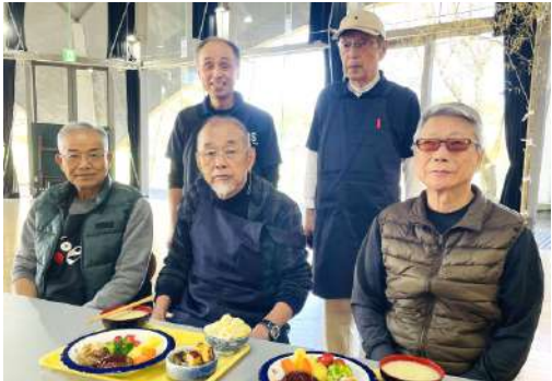
男の料理塾の参加者の皆さん