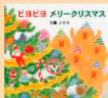
「ピヨピヨメリークリスマス」 工藤ノリコ：作 (佼成出版社)