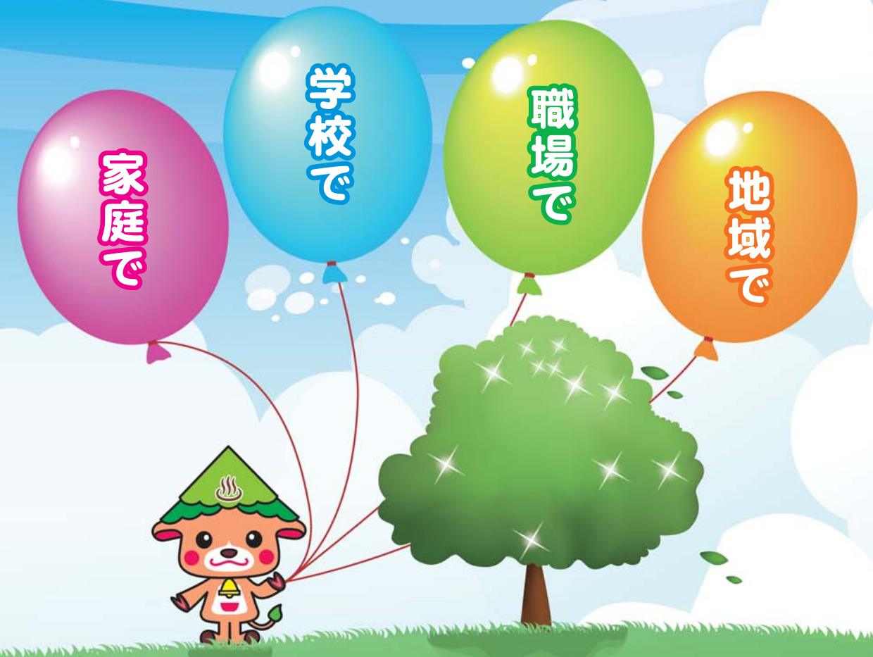
小国町 ゆるキャラ 「おくたん」