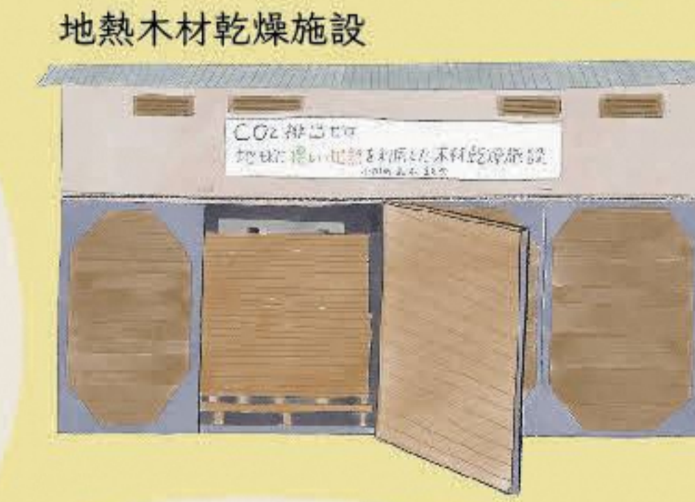
地熱木材乾燥施設